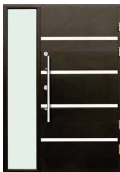
PŘÍKLAD: Pevný boční světlík s prosklením - sklo v rámu