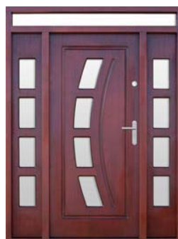
PŘÍKLAD: Nadsvětlík + 2x pevný boční světlík s prosklením - imitace dveří